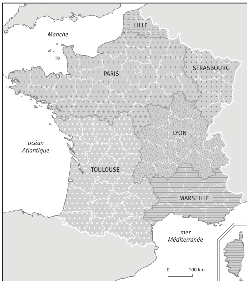
Carte 3. Le réseau consulaire de Pologne au mois de mai 1945

Carte établie par l'auteur. Sources : CAD, Pologne, art. 4, lettre : ambassade de Pologne à Paris au MAE, Paris, le 19 mai 1945, fol. 77 ; ibid. , nominations consulaires de B. Samborski, C. Bitner, W. Obrębski, S. Domański, R. Wodzicki et T. Nagórny, Londres, le 27 février 1945, fol. 78-83 ; AAN, ambassade de Pologne à Paris, art. 331, information sur le réseau consulaire de Pologne en France et en Afrique du Nord d'octobre 1944 et juin 1945, [s.l.n.d.], fol. 70-74.