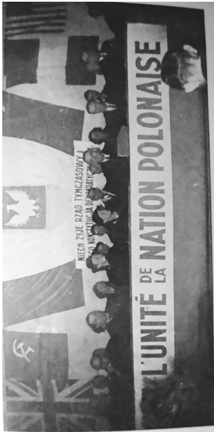
1 re assemblée générale du Comité polonais de libération nationale en France (Polski Komitet Wyzwolenia Narodowego we Francji), dans Sprawozdanie z pierwszego walnego zjazdu wychodźstwa polskiego we Francji, 17-18 grudnia 1944 roku [Compte rendu de la 1 re assemblée plénière de l'émigration polonaise en France des 17-18 décembre 1944] (Paris, 1945, photographie sur une page non numérotée).