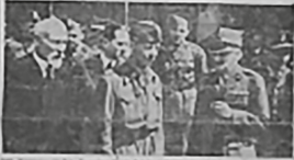
Polscy żołnierze w mundurach wojskowych.