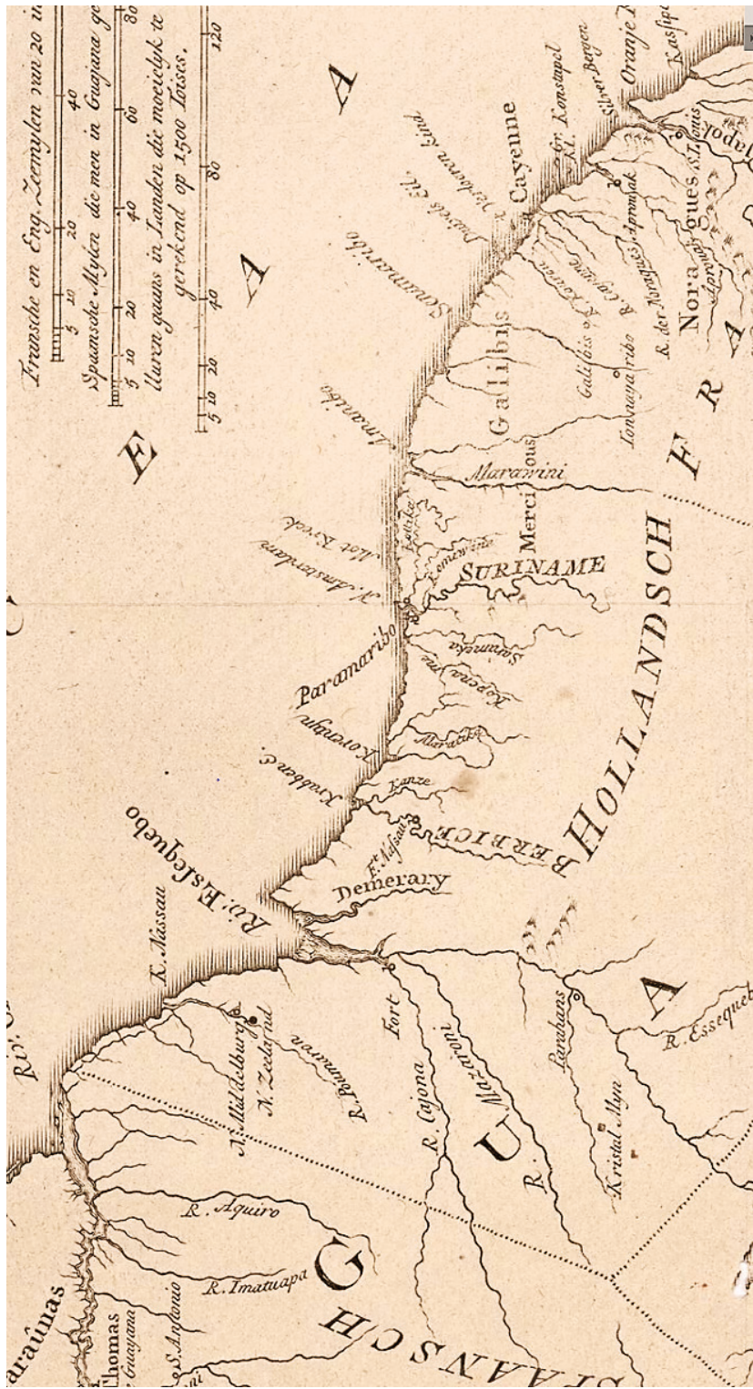
Carte 1. La Guyane hollandaise : Essequibo, Demerara, Berbice, Suriname, Paramaribo.