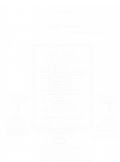
Fig. 241. Corrado Govoni, « Specchio » [« Miroir »], Lacerba (Florence), t. III, n° 8, 21 février 1915, p. 61

La mise en page de Lacerba crée un effet de contiguïté et de continuité, qui n'est pas uniquement d'ordre matériel, entre textes et images. Dans la livraison du 1 er juillet 1913, le manifeste de Boccioni « La scultura futurista » [« La sculpture futuriste »] jouxte la reproduction du tableau de Soffici, Scomposizioni dei piani di un ponte [Décompositions des plans d'un pont] : sculpteur et peintre futuristes œuvrent dans la même direction. Le 15 octobre de la même année, le lecteur découvre sur la même page « La Conversion d'Émile Cordier (Saint Matorel) » de Max Jacob et le dessin Dinamica di un ciclista [Dynamique d'un cycliste] de Boccioni : le rapprochement de la prose