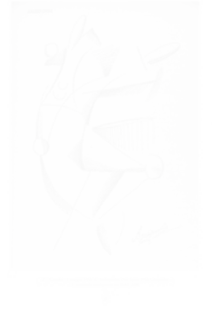
Fig. 235. Archipenko, Due figure [Deux figures], Lacerba (Florence), t. II, n° 9, 1 er mai 1914, p. 13

Palazzeschi, Ungaretti, Sbarbaro – qui souvent n'ont rien à envier, pour ce qui est de la modernité et de l'expérimentation, à leurs confrères parisiens 9 .