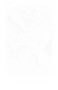
Fig. 236. Gino Severini, Danza serpentina [Danse serpentine], Lacerba (Florence), t. II, n° 13, 1 er juillet 1914, p. 202