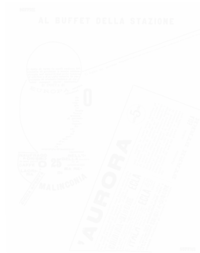
Fig. 240. Ardengo Soffici, « Al buffet della stazione » [« Au buffet de la gare »], Lacerba (Florence), t. II, n° 15, 1 er août 1914, p. 236

L'interaction entre texte et image est constante dans Lacerba . L'évolution de la présentation typographique et de la mise en page de la revue est des plus révélatrices : sobres au début (fig. 239), elles participent de plus en plus de la révolution typographique prônée par le futurisme. Les tables de mots en liberté font exploser la mise en page (fig. 240). Les manifestes futuristes, et leurs applications pratiques, se configurent de plus en plus comme des iconotextes. Les pages de Lacerba prennent souvent l'allure d'un collage, d'une composition d'avant-garde. Les manifestes de Marinetti se donnent d'abord à voir, à contempler comme des formes, des images, avant de délivrer leur message textuel. Carlo Carrà, peintre et poète, met en scène et en page ses mots en liberté. Les poèmes visuels de Govoni, dont la naïveté n'est qu'apparente, retrouvent des formes enfantines (fig. 241).