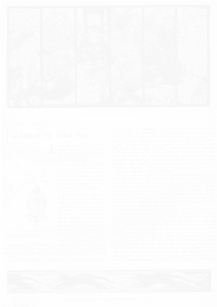
Fig. 97. Page de titre de l'article d'Edmond Deschaumes, « Le Cabaret du “Chat Noir” » Revue encyclopédique (Paris), 16 janvier 1897, p. 42

On a beaucoup raconté le “Chat Noir”. Personne n’a encore écrit cependant l’exacte biographie de Rodolphe Salis. Je veux tenter ici cette besogne. Elle eût, je crois, séduit Plutarque.