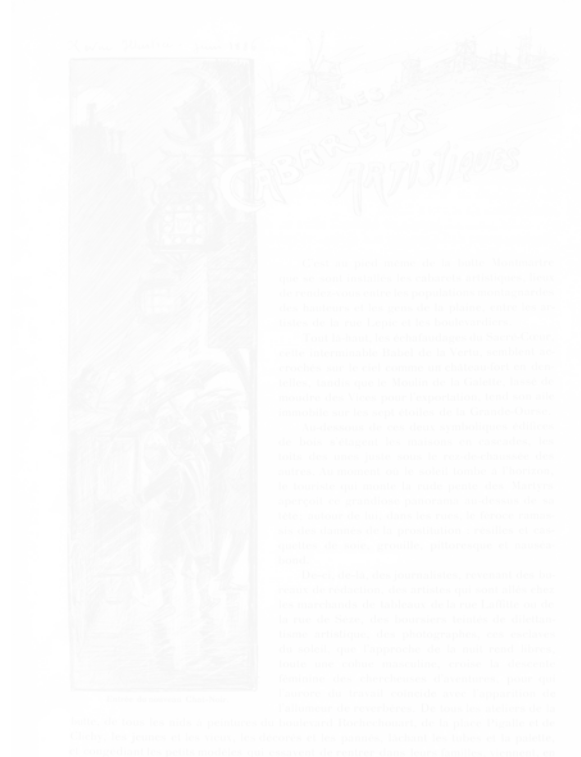
Fig. 93. Henri Rivière, page de titre pour Émile Goudeau, « Les cabarets artistiques » Revue illustrée (Paris), 15 juin 1886, p. 449

Camille Pissarro, Edgar Degas, etc. –, l'Auberge du Clou, ou l'Abbaye de Thélème. Après avoir décrit l'intérieur de l'ancien Chat Noir, Goudeau affirme que ce qui le différenciait de la Grand'Pinte « fut l'invasion de ces deux arts : la poésie et la musique, dans un sanctuaire consacré à la peinture ». Il continue : « comme il y a deux Testaments, il y a un Nouveau Chat-Noir rue de Laval, seulement il n'y a qu'un dieu : Rodolphe Salis. [...] c'est l'apothéose du Cabaret artistique » 6 .