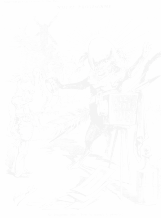
Fig. 92. Rodolphe Salis, dessin dans Le Chat Noir (Paris), 14 janvier 1882 cliché Jane Voorhees Zimmerli Art Museum

Dans le tout premier numéro du Chat noir , Salis publia en pleine page la photogravure en relief d'un de ses dessins, intitulé « Notre programme ». Il représentait un grand chat noir en costume de mousquetaire, armé d'une plume d'oie et se tenant debout derrière un appareil photographique, qui symbolisait la récente invention du procédé de la photogravure en relief (fig. 92). Au loin, se trouve le Moulin de la Galette, la célèbre salle de bal située au sommet de la butte Montmartre. Tandis que le chat noir mousquetaire photographie un groupe de personnages zoomorphes à la Grandville, il crie, faisant allusion à Montmartre et à son cabaret : « Ne bougeons plus ! Tout le monde y passera ! ». De fait, la prédiction représentée par Salis se réalisa.