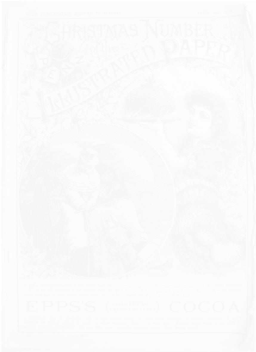
Fig. 6. Traîneau dans la neige, Christmas pudding et publicité pour une marque de cacao (voir cahier couleur I, pl. II)

Le titre fondateur en 1861 de la presse illustrée populaire à bon marché, The Penny Illustrated Paper (Londres), a également publié des Christmas Numbers . Celui de 1889 ne compte que 32 pages et il est imprimé en noir et blanc, avec une couverture bleue. Alors que la photographie a été à cette époque largement adoptée par la presse illustrée haut de gamme, le magazine reste entièrement fidèle à la gravure sur bois.