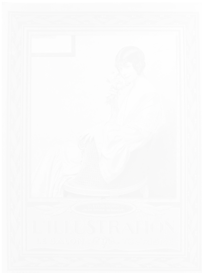
Fig. 3. D. Etcheverry, Jeune femme au bouquet (voir cahier couleur I, pl. III)

Ce numéro « Le Salon – Tourisme » de L'illustration (Paris) est daté du 8 mai 1926. Il comprend, outre de très nombreuses publicités et reproductions de tableaux à dominante noir et blanc, plusieurs planches hors-texte en couleurs, de haute qualité (impression et papier), prêtes à être encadrées dont un portrait pleine page du président de la République, Gaston Doumergue, peint par Marcel Baschet, l'un des frères du directeur de l'hebdomadaire à cette époque, René Baschet.