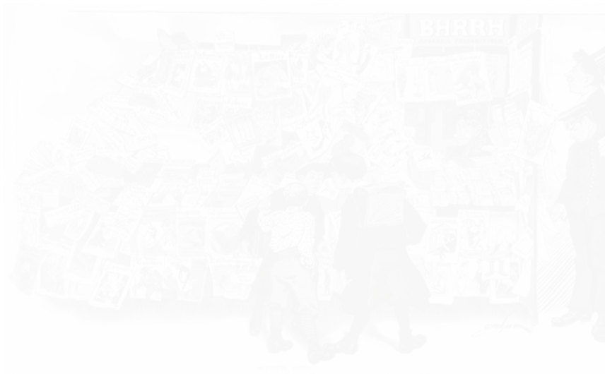
1. Jules Grandjouan, dessin paru dans le numéro spécial « Un peu de Publicité » entièrement réalisé par Grandjouan, Le Rire , 8 e année, n° 406, 16 août 1906, p. 8-9, coll. part. (voir cahier couleur I, pl. Ia)