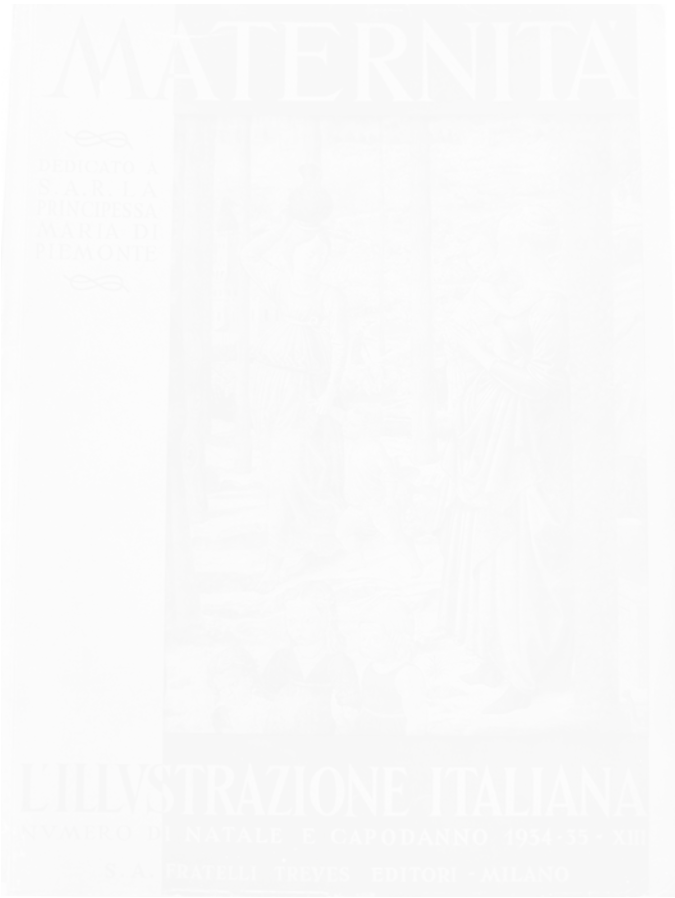
Fig. 4. Benozzo Gozzoli, détail d'une fresque du Camposanto de Pise

Publié pour la Noël et le jour de l'an 1934-1935, ce treizième numéro spécial de L'Illustrazione Italiana , édité par les frères Treves à Milan, est titré Maternità et dédié à S.A.R. la Princesse Maria du Piémont. Très proche du modèle anglais et de sa déclinaison française, il recèle également des hors-texte de qualité, protégés par une serpente, dont un portrait de la Princesse et de sa jeune fille Maria Pia.