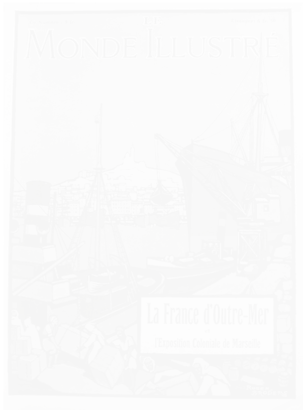
Fig. 7. Roger Broders, vue du port de Marseille (voir cahier couleur I, pl. IV)

Principal concurrent de L'Illustration , Le Monde illustré (Paris) s'est lui aussi lancé dans des numéros spéciaux, moins luxueux et moins chers (ici, cinq francs, alors que ceux du titre phare en valaient au même moment le triple). Consacré à la France d'outre-mer à l'occasion de l'exposition coloniale de Marseille, ce numéro du 16 décembre 1922 est entièrement monochrome, sauf pour la couverture et le dos. Préfacé par Albert Sarraut, ministre des Colonies, il s'inscrit sans réserve dans la logique coloniale française.