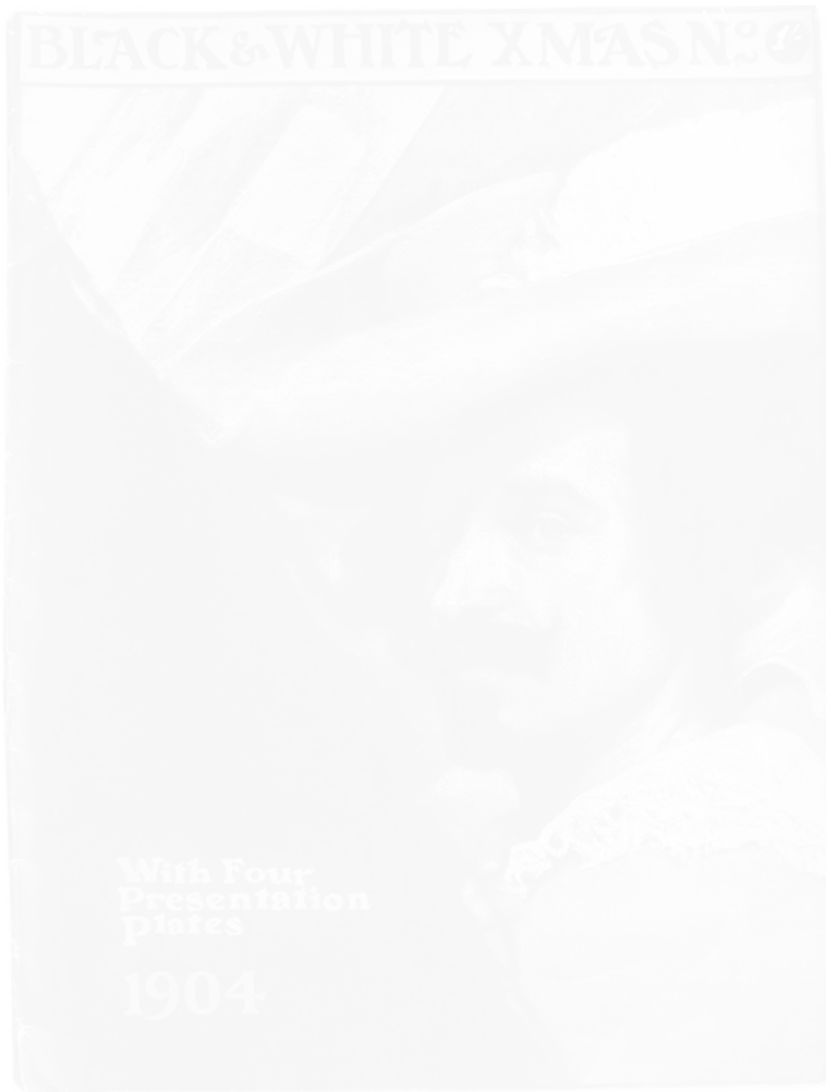
Fig. 5. Autoportrait de Velásquez, repris en hors-texte à l'intérieur du magazine, 1904

véritable musée imaginaire, au sens où le pensa bien plus tard, et en France, André Malraux. Les numéros spéciaux auront donc vulgarisé tout un ensemble de connaissances culturelles, sur un fond idéologique très classique de célébration de la famille chrétienne. Avec des reproductions de tableaux et de nombreux dessins originaux, dont certains renvoient directement à cette idéologie, ils auront au surplus révolutionné le marché de la presse illustrée et, pour partie, celui du livre illustré (fig. 5).