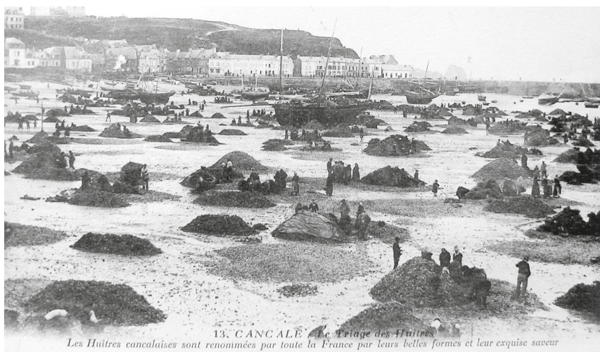
Le tri des huîtres à Cancale au début du xx e siècle, carte postale

Une fois la pêche achevée, les bisquines de Cancale déchargent leur cargaison sur l'estran et ce sont les femmes qui sont alors chargées de les trier avant leur commercialisation.