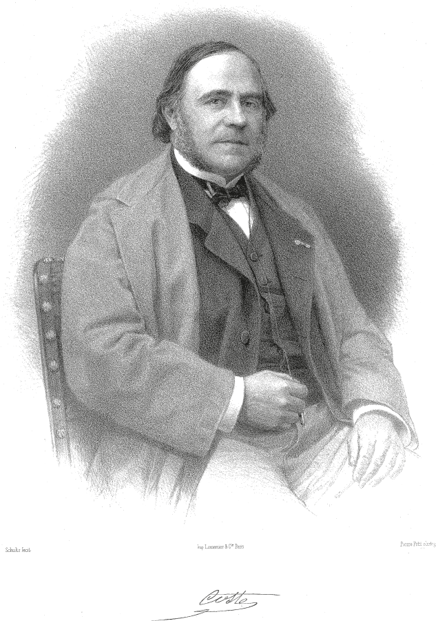
Portrait de Victor Coste par Schultz, lithographie, collection particulière