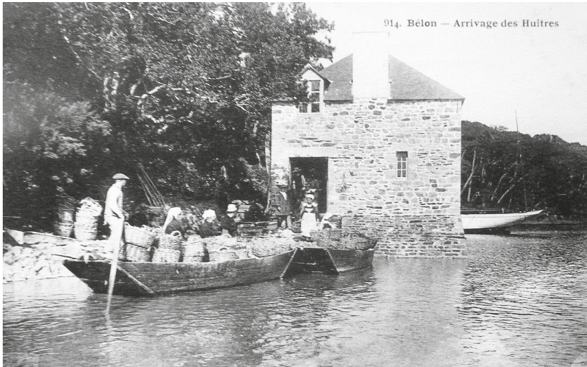
L'arrivage des huîtres à Riec-sur-Bélon, vers 1910-1920, carte postale, collection particulière

Encore une scène posée mais qui permet d'observer une barge chargée des paniers d'osier (les « mannes ») remplis d'huîtres récoltées sur les parcs à marée basse. Elles sont ensuite triées avant revente. Les exploitants de la ria de Riec ont su proposer un produit de qualité, qui ne fut que marginalement affecté par la crise des années 1920 et cet espace reste, encore à l'heure actuelle, l'un des principaux espaces de production d'huîtres plates en Bretagne.