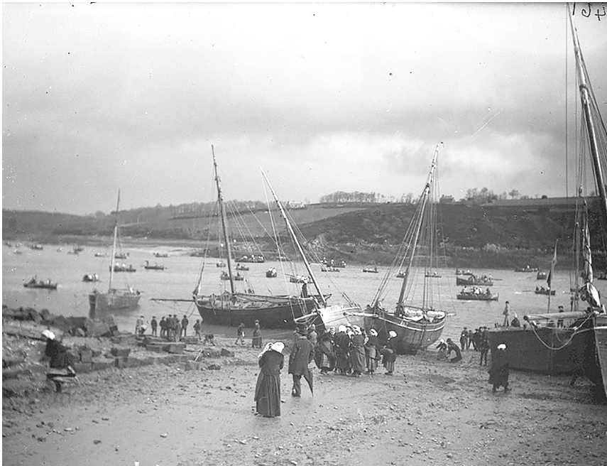
La drague des huîtres en rivière de Tréguier à la fin du XIX e siècle, plaque photographique, collection Armel galerie, Paimpol

Depuis le XVIII e siècle, l'exploitation des bancs d'huîtres de la rivière de Tréguier est alternativement libre et soumise à de très sévères restrictions de pêches, conséquence directe des périodes de liberté... Cette vue des années 1895 permet de constater, à marée haute, l'importante flottille qui drague les bancs. À marée basse, l'estran est littéralement envahi par les riverains.