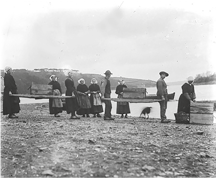
Une exploitation ostréicole sur les berges du Trieux, vers 1895, plaque photographique

À cette époque survient une phase de mévente due en grande partie à « la tendance actuelle des parqueurs à faire produire à leur concession des quantités de mollusques disproportionnées avec les débouchés actuels de leur industrie » 28 . Il s'agit donc à la fois d'une crise de surproduction et d'une baisse de qualité des produits : devant les bénéfices engrangés, les ostréiculteurs ont tendance à cultiver de plus en plus, augmentant de manière spectaculaire les rendements à l'hectare, oubliant toutefois qu'il leur faut, à l'autre bout de la chaîne, trouver des