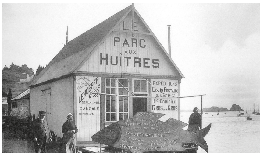
Le parc aux huîtres de Cancale, carte postale, collection particulière

Une fois la pêche achevée, les bisquines de Cancale déchargent leur cargaison sur l'estran et ce sont les femmes qui sont alors chargées de les trier avant leur commercialisation.