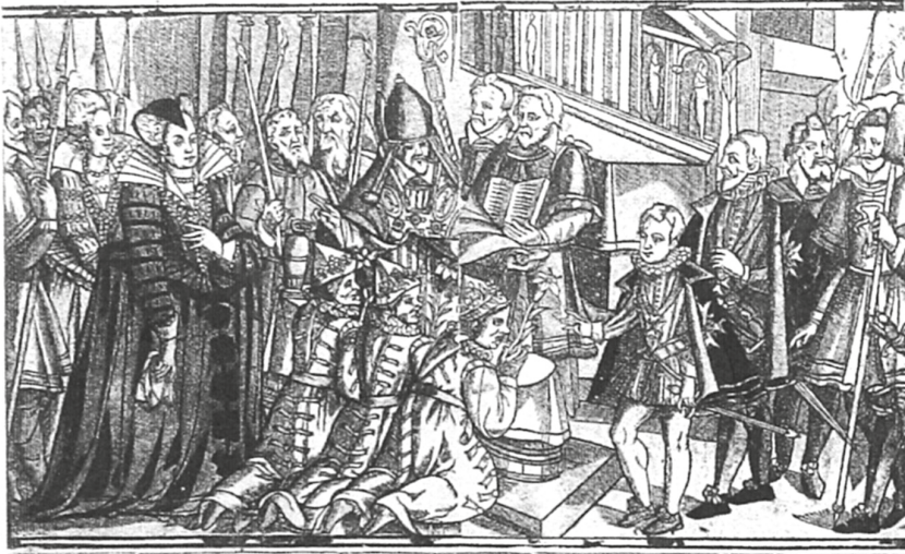
Fig.1 : Pierre Frens, « Le Baptême de Trois Sauvages Tououpinanbous, qui furent baptizez en l'Eglise des Capucins... », Paris, Michel Malebourse, 1613, BnF, Cab. des Est., Qb1, 1613, M. 88 978

pour commémorer le baptême de trois Tupi, qui souligne leur « humaine gloutonnerie » et leur rage à répandre le sang de leurs semblables (fig. 1) 14 . Miroir de l'homme chrétien, l'homme tupi du capucin est formé d'un corps et d'une âme composée de trois facultés et de deux appétits, l'irascible et le concupiscible, qui logent dans le cœur (fig. 2). À défaut d'être diligentées par un usage vertueux de la raison, les passions font de l'individu un « homme criminel », selon les moralistes. Le premier XVII e siècle a privilégié l'élaboration d'une imagologie des peuples à partir de stéréotypes nationaux, souvent étayés à partir de l'analyse de leurs humeurs. Dans son XX e chapitre, le capucin décrit les vices et les vertus des Indiens, certes consubstantiels à toute humanité, mais particularisés en fonction des peuples. Le plus redoutable de leurs vices serait ainsi leur propension à la vengeance, coextensive au rituel cannibalique 15 , mais néanmoins freinée par la