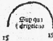
Fig. 2. Sideralis abyssus , 1514, fol. 62v° (Orion)

Virtutū & vltimū locum temperantia inter virtutes Cardē nales tenens cōsideranda pponitur. Ponitur ab Ari. 2. ethico. inter insensibilitatem intemperantiæq; media. Taculus videlicet delectationes equo moderamine librans. hanc Isidorus diffinit in ethimologiarum libro. Temperantia est qua libido concupiscentiæq; refrenatur. Et Tullius. Temperantia est rationis in libidinem atq; in alios non reotos impetus animi firma & moderata dominatio. Augustinus in libro de moribus ecclesie dicit q; ad temperantiam pertinet deo se integrum incorruptumq; seruare p canem maiore designē. Rō est q; ad qu prudentiā. s. v. si pratis. 19. proportio est) per quadripartiens.