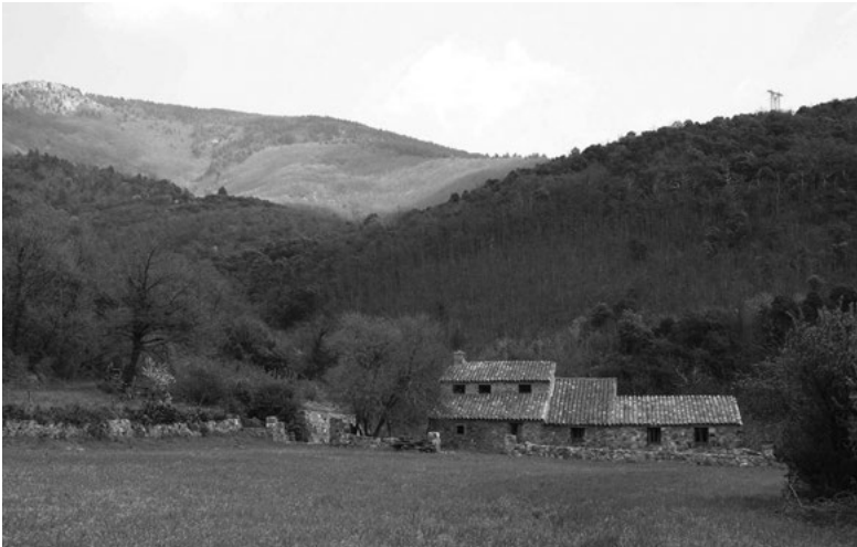
2. Mas de l'Albère. Du piémont à mi-pente (500 mètres), le mas est l'habitat dispersé caractéristique du massif.

perception des droits seigneuriaux. Au XIII e siècle, les premiers livres de reconnaissances, ou capbreus en catalan 4 , dans lesquels les seigneurs consignent les biens soumis aux redevances, distinguent l'unité économique d'exploitation servant de base aux prélèvements seigneuriaux, désignée comme mansata , borda ou demi borda (par ordre d'importance décroissant), de l'habitat principal, le mansus ou le caput mansus . Cette dichotomie se poursuit jusqu'au XV e siècle où un glissement sémantique se fait jour. Dans le capbreu de la seigneurie de Laroque-des-Albères de 1455, plusieurs déclarations fusionnent les deux notions en une seule : le mansus devient à la fois l'habitat et l'unité économique ; il prévaudra désormais dans les capbreus ultérieurs de cette seigneurie, toujours dans sa forme latine au XVI e siècle, puis catalane mas au XVII e siècle, et française métairie au XVIII e siècle. C'est dans le seul cadre du mansus , c'est-à-dire du mas en tant qu'habitat, que nous poursuivrons notre propos.