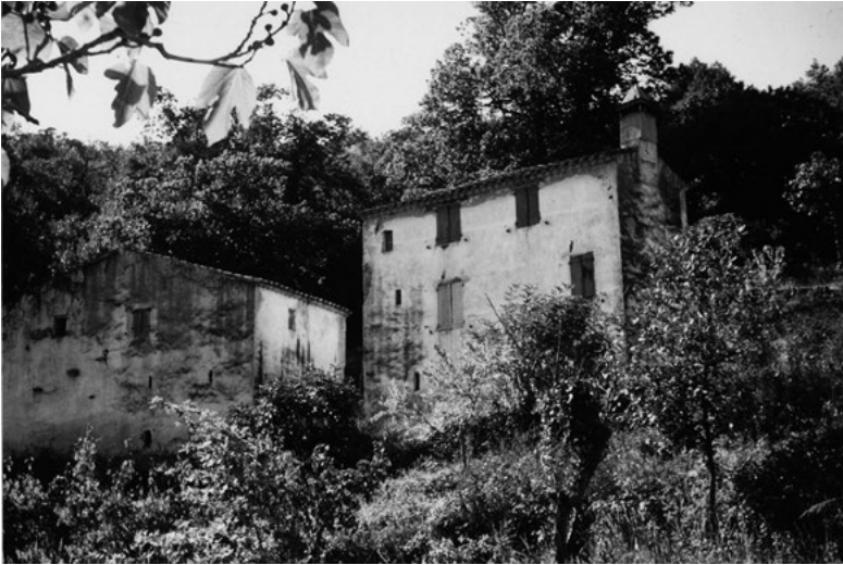
Fig. 12. Le mas d'en Durbau à Laroque-des-Albères

Au mas Chevalier, on peut dater l'importante extension du cortal et du chai du tout début du XIX e siècle, car déjà en 1815 le chevalier de Montferrer, renouvelle à Joseph Danyac le bail à ferme d'un « domaine ou corps d'héritage [...] consistant en champs, prés, olivettes, vignes, bois, bâtisses et autres terres 34 ». Ce nouveau bâtiment, imposant est porté au cadastre Napoléon de 1822.