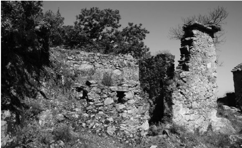
3. Conséquence de la misère générée par les guerres et les famines, de nombreux mas sont abandonnées au cours du XVI e siècle (ici le mas Moreu).

Sant Joan d'Albera distant de cinq kilomètres. L'état de délabrement de l'habitat l'oblige quelques mois plus tard à réaliser des travaux qu'il confie à un maçon du village voisin de Saint-Génis des Fontaines 11 . Les murs et le four à pain sont remontés, les poutres changées et le toit refait.