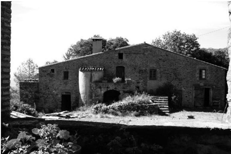
6. Le mas Reste à Sant Martí d'Albera

L'orientation du bâtiment principal se fait toujours par opposition au vent du nord dominant, la tramontane, privilégiant une exposition au midi pour l'entrée et les ouvertures principales.