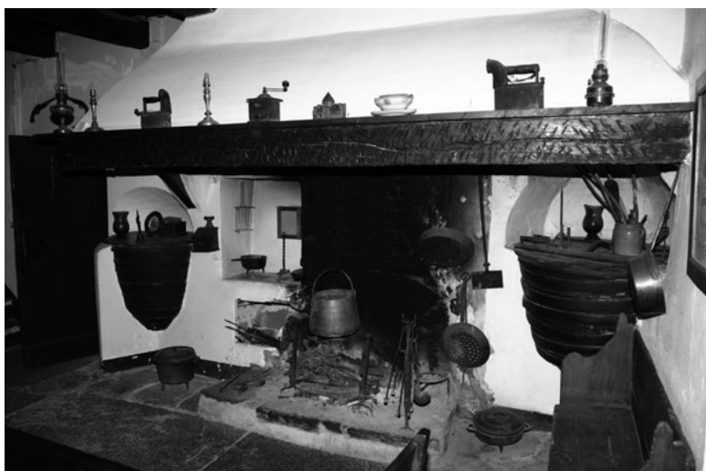
10. Cheminée typique d'un mas avec ses bugaders encastrés (mas Reste, Sant Martí d'Albera)