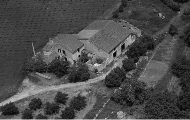
4. Le mas Chevalier, ancien mas d'en Candell y d'en Trias