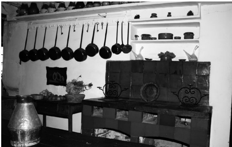
9. Le fogó , fourneau potager

La pica : cuvier ou évier taillé dans un bloc de pierre et encastré dans le mur ; à partir du XVIII e siècle, le marbre gris ou rose est souvent préféré à la pierre.