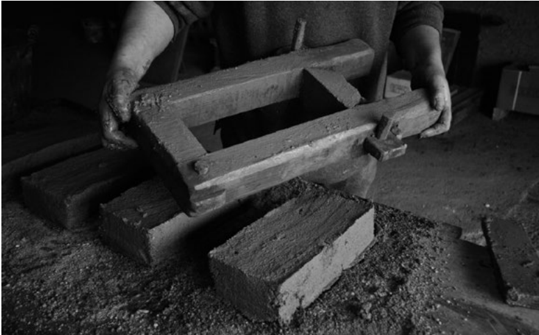
7. Fabrication d'un caïró ( cayrou )

Si la terre argileuse reste encore utilisée comme liant, le mortier de chaux vient la renforcer ou s'y substituer ; il est aussi employé sous forme de crépis pour consolider les murs. Les ruines de nombreux fours à chaux près des mas attestent l'utilisation fréquente de ce matériau.