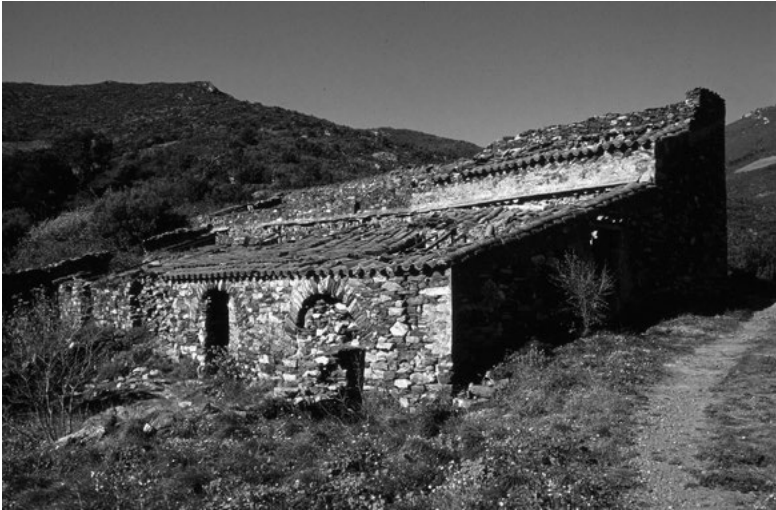
11. Cortal du mas des Abelles à Banyuls-sur-Mer

À partir du XVIII e siècle, le cortal profite des progrès des techniques de construction et gagne en hauteur. Si plan rectangulaire et toiture mono-pente demeurent, les murs diaphragmes disparaissent pour laisser place à de gros piliers centraux qui supportent la charpente et permettent d'ancrer un plancher servant de pailler. Cette vaste halle peut-être divisée en autant de sous espaces servant à séparer les animaux.