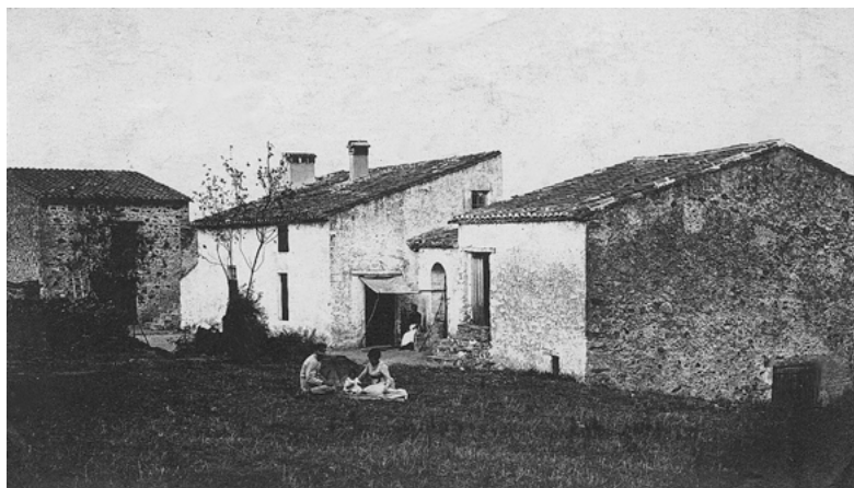
5. Le mas d'en Massot d'Avall au début du xx e siècle