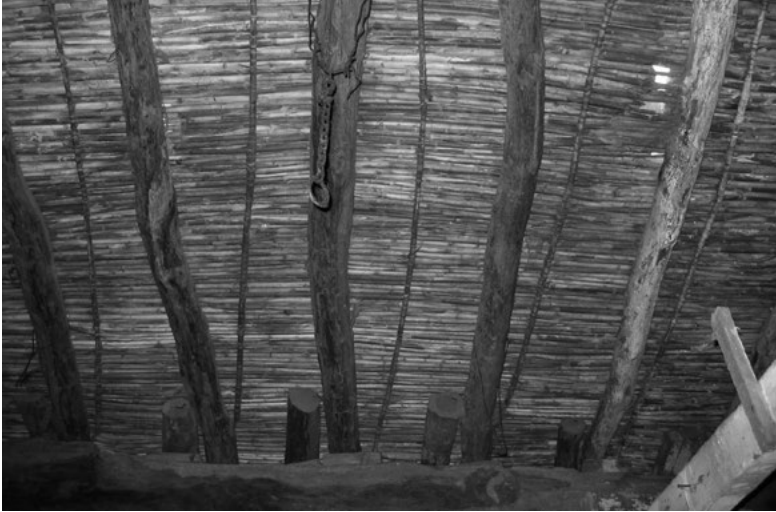
8. Assemblage de roseaux liés par de la corde dit encanyissat