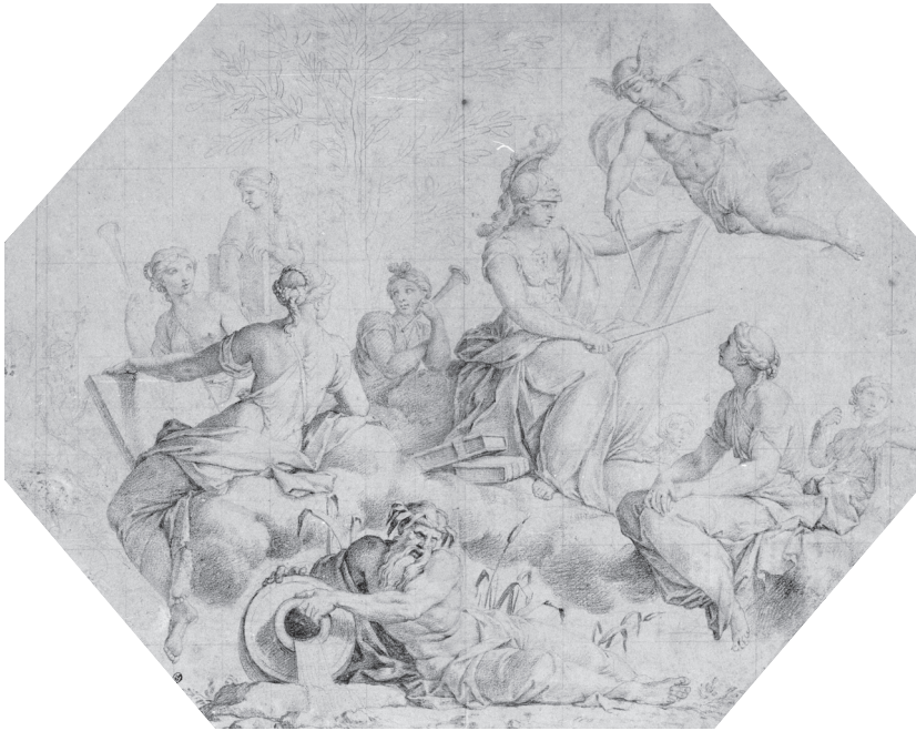
2. Eustache Le Sueur (attribué à), Le Parnasse , vers 1653, dessin : 31,6 x 39,7 cm. Paris, musée du Louvre, département des Arts graphiques, inv. 30823, recto.

La pièce est célèbre pour les décors des plafonds et lambris dus à Eustache Le Sueur assisté de Charles Poërsen le Père pour l'ornementation 54 . Dans le carré de la chambre, Guillet de Saint-Georges nous apprend que :